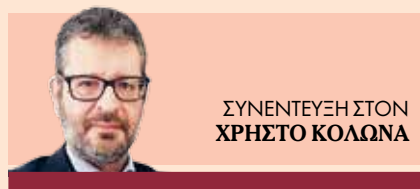
ΣΥΝΕΝΤΕΥΞΗ ΣΤΟΝ ΧΡΗΣΤΟ ΚΟΛΩΝΑ

Ο πρόεδρος του UN Development Solutions Network Greece και καθηγητής στο ΕΚΠΑ επισημαίνει στα «ΝΕΑ Σαββατοκύριακο» τις άμυνες που αναπτύσσουν οι ΗΠΑ, η Ευρώπη και η Κίνα απέναντι στις κρίσεις που δοκιμάζουν τους στόχους του ΟΗΕ