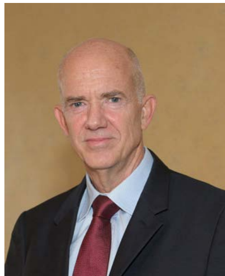
Ανδρέας Παπανδρέου Καθηγητής ΕΚΠΑ

Γενικός Διευθυντής του ΙΟΒΕ - Ίδρυμα Οικονομικών και Βιομηχανικών Ερευνών